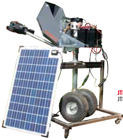
JTB Premium mit Solarladegerät JTB Premium with solar charger